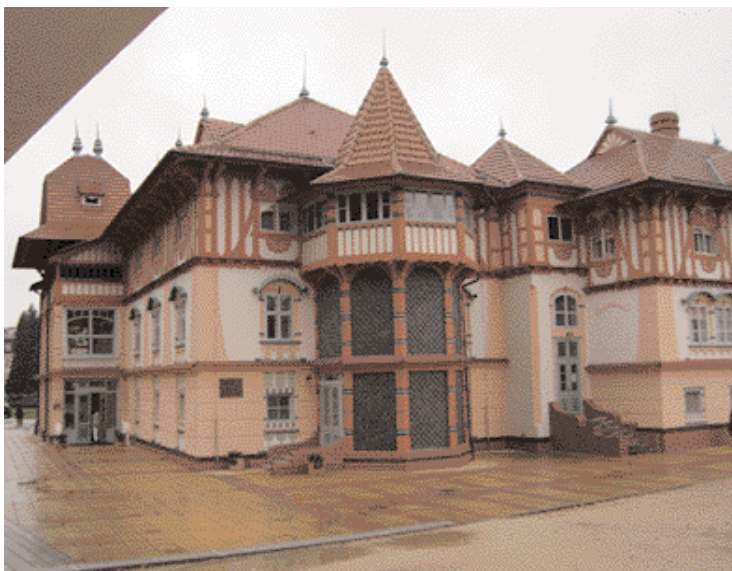
Dominantou Luhačovic je Jurkovičův (dříve Janův) dům. Také zde se Leoš Janáček léčil.