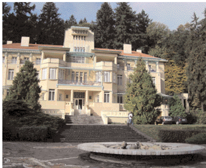
Jedním z lázeňských domů, které skladatel navštěvoval, je nynější Dům Bedřicha Smetany.

Skladatel Leoš Janáček využíval blahodárné působení tradičních léčivých minerálních pramenů hlavně brzo ráno, kdy vycházel do okolí.