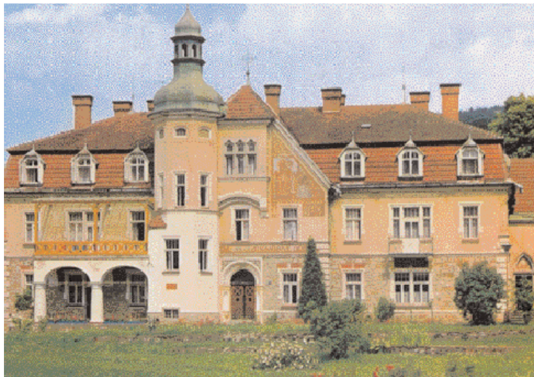
Nejčastěji trávil letní ozdravné pobyty v nedalekém Augustiniánském domě, kde v letech 1922 a 1926 napsal Lišku Bystroušku a slavnou Glagolskou mši, jež jsou vyvrcholením jeho celoživotního díla.