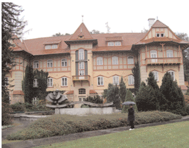
Jednou navštívil i vilu Jestřabí. Její kouzlo přitahuje návštěvníky dodnes, a vůbec jim nevádí, že prší.