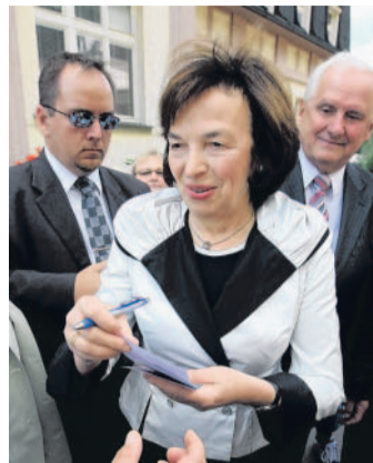
Festival Janáček a Luhačovice navštěvuje i první dáma Livia Klausová.

nebo komponoval. Potkal zde také důležité ženy svého života, které se staly jeho múzami. V Pražské čtvrti se například náhodně setkal s Kamilou Stösslovou, s níž ho pojilo až do konce života důvěrné přátelství.