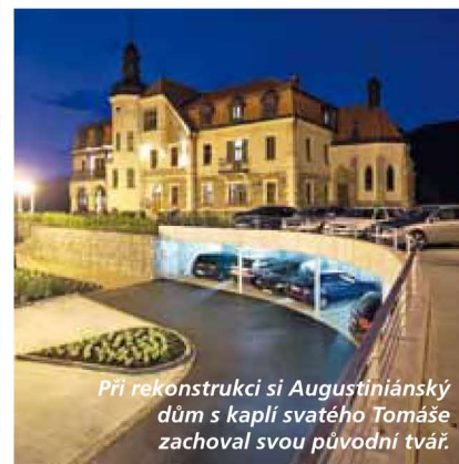
Při rekonstrukci si Augustiniánský dům s kaplí svatého Tomáše zachoval svou původní tvář.

Místo, jež Leoše Janáčka inspirovalo ke složení opery Liška Bystrouška, má magickou moc.